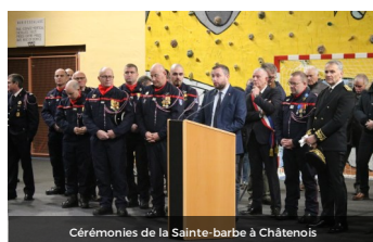
Cérémonies de la Sainte-Barbe à Châtenois