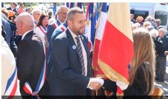
Inauguration de l'espace mémoire du Maquis de Grandrupt