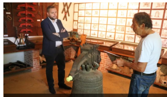
Visite de l'ancienne Fonderie de Cloches de Robécourt