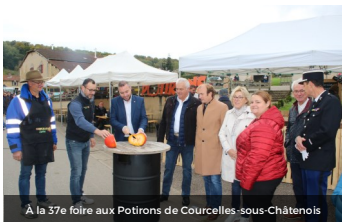
À la 37e foire aux Potirons de Courcelles-sous-Châtenois