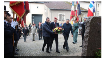
Cérémonie de la Saint-Michel à Florémont