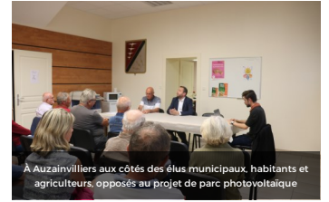
À Auzainvilliers aux côtés des élus municipaux, habitants et agriculteurs opposés au projet de parc photovoltaïque