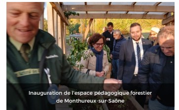
Inauguration de l'espace pédagogique forestier de Montheureux-sur-Saône