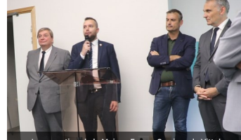
Inauguration de la Maison France Services de Vitte