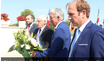
Cérémonie mémorielle au monument aux morts d'Autreville