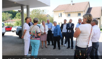
Visite de l'EHPAD de Ville-sur-Illon suite aux inondations