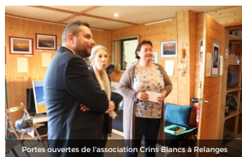
Portes ouvertes de l'association Crins Blancs à Relanges