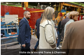
Visite de la société Trane à Charmes