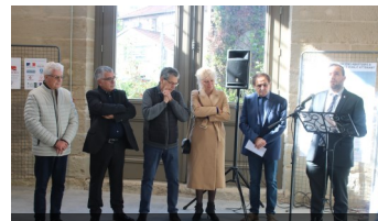
Remise du Prix «Les Rubans du Patrimoine» à Darney