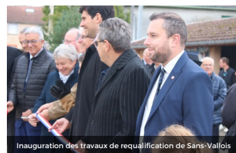
Inauguration des travaux de requalification de Sans-Vallois