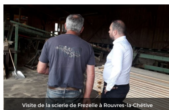
Visite de la scierie de Frezelle à Rouvres-la-Chétive