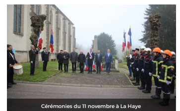
Cérémonies du 11 novembre à La Haye