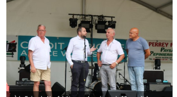
À la Foire de Neufchâteau, relancée après 16 ans d'absence