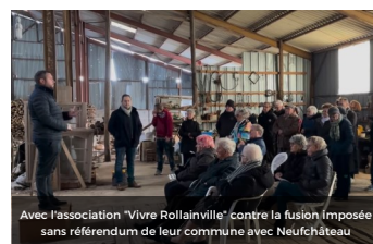
Avec l'association «Vivre Rollainville» contre la fusion imposée sans référendum de leur commune avec Neufchâteau