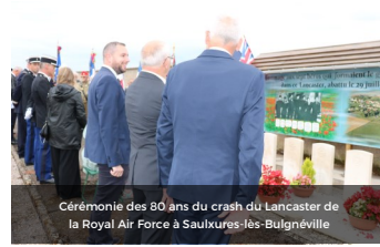
Cérémonie des 80 ans du crash du Lancaster de la Royal Air Force à Saulxures-Jés-Bulgnéville