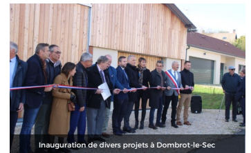
Inauguration de divers projets à Dombrot-le-Sec