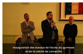
Inauguration des travaux de l'école, du gymnase et de la crèche de Lamarche