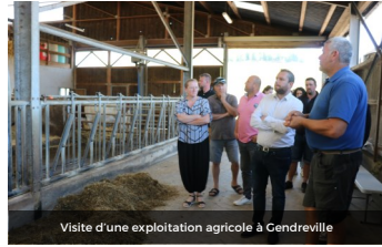
Visite d'une exploitation agricole à Gendreville