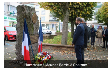
Hommage à Maurice Barrès à Charmes