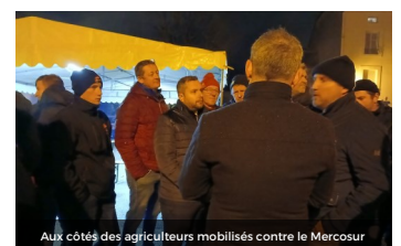
Aux côtés des agriculteurs mobilisés contre le Mercosur