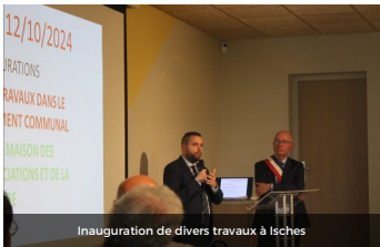
Inauguration de divers travaux à Isches