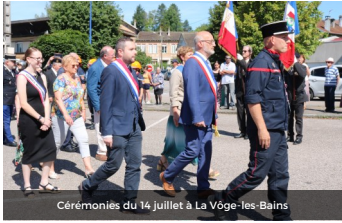
Cérémonies du 14 juillet à La Vège-les-Bains