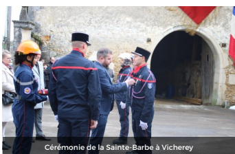
Cérémonie de la Sainte-Barbe à Vicherey