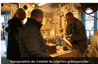
Inauguration de «l'atelier du charron» à Bouxurullles